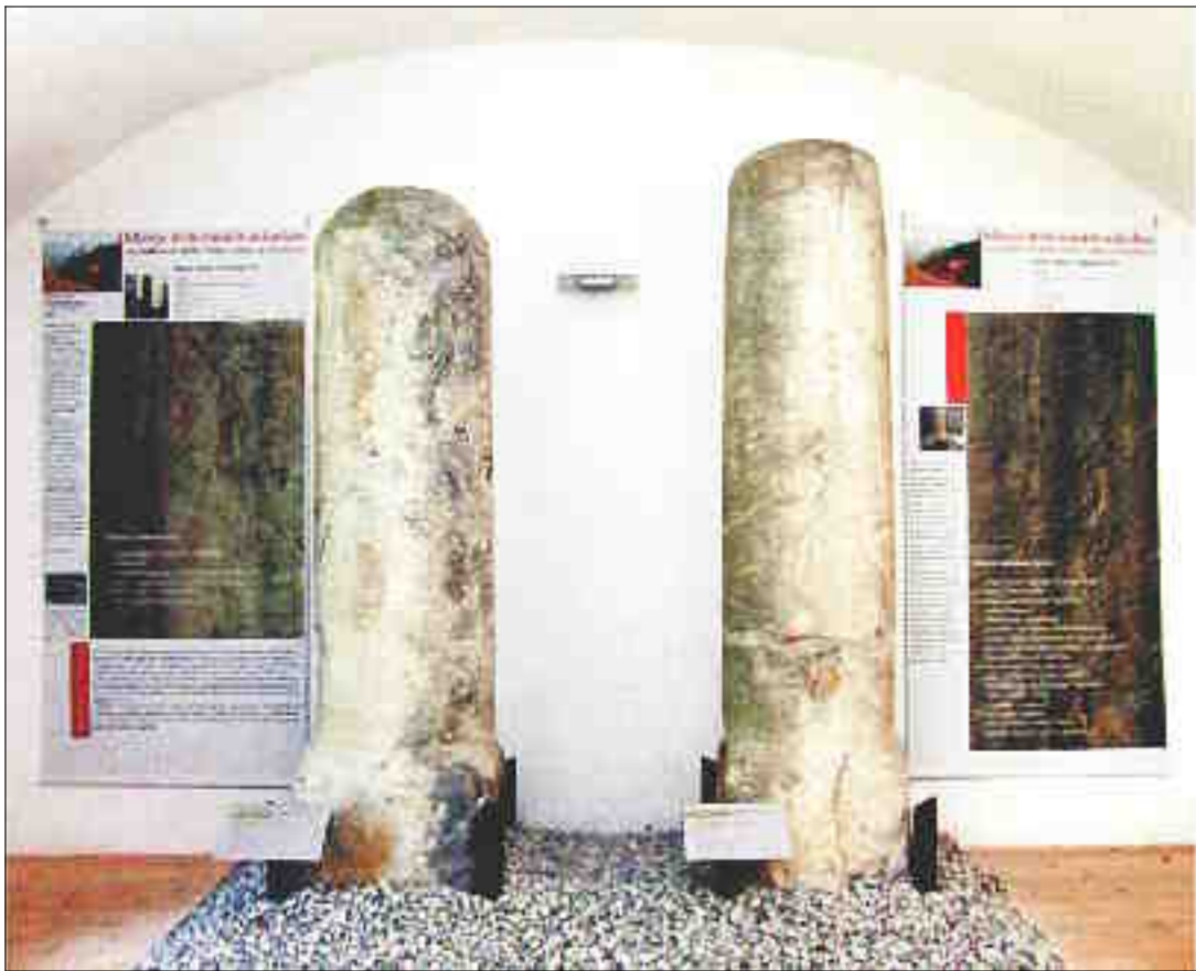
NAKLJUČNA NAJDBA – Rimska mljlnika Antonina Pija in Septimija Severa in njegovih sinov, restavrirana in postavljena v vhodni veži gradu Grm v Novem Mestu.